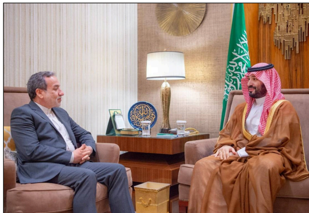
Prinz Mohammed bin Salman, saudischer Kronprinz, (R) empfängt den iranischen Aussenminister Abbas Araqchi am 9. Oktober 2024 in Riad.

Insgesamt positionieren sich die Golfstaaten so, dass sie zu den wichtigsten Akteuren bei der derzeitigen Machtverteilung in ihrer Region – und in der Welt – gehören. Teheran und Riad haben einen Weg gefunden, die Nachbarschaft auf