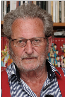
Werner Rügemer

Extrait du livre «Amitié fatale» par Werner Rügemer*