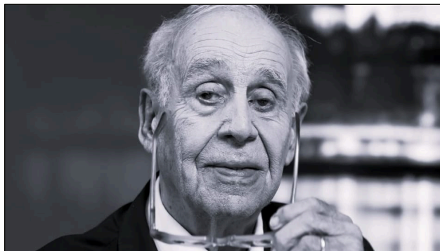
Jean Ziegler, à un âge avancé.