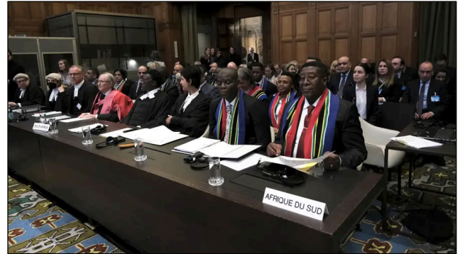
Anhörung im Verfahren gegen Israel wegen des Verdachts des Völkermords vor dem Internationalen Gerichtshof am 11. Januar 2024.

gefügt hat, und erklärt, warum noch viel mehr Tod und Zerstörung auf sie zukommen werden.